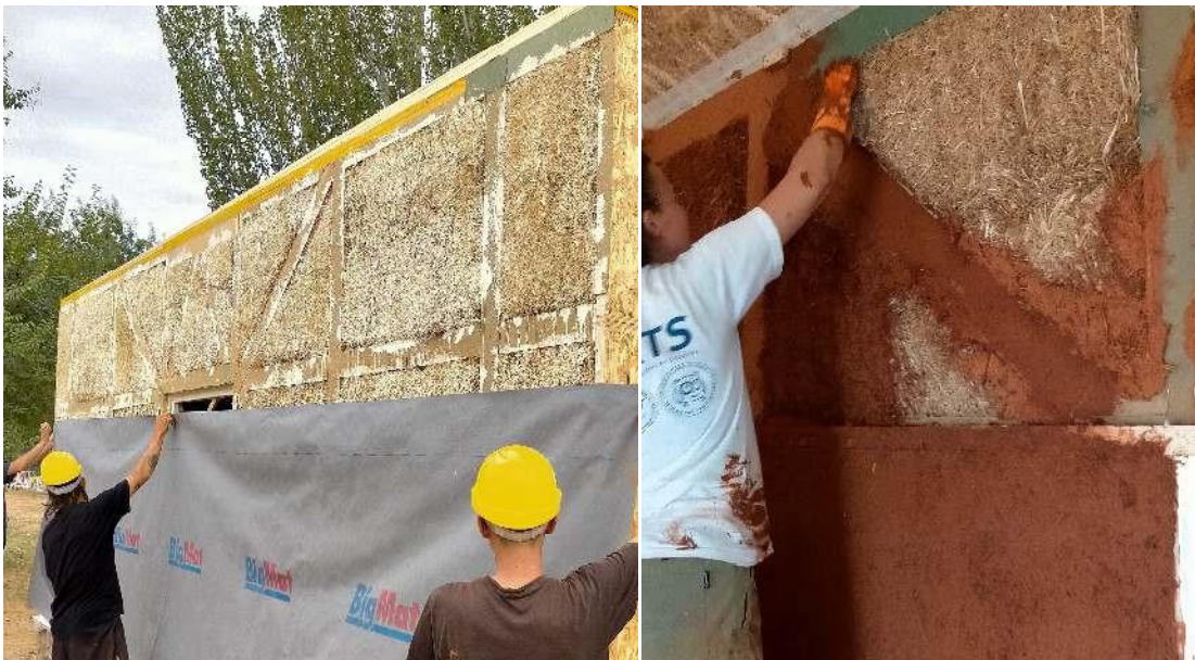
Imagen: acabados exteriores e interiores con distintas soluciones de morteros de cal y tierra.