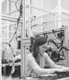
Participa en un proyecto de innovación social, financiado por el Fondo Social Europeo