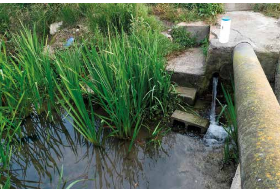
Toma de muestras en la Comarca de La Safor

nitratos. Igualmente, todas las muestras que se tomaron (6) en la comarca de Verín cumplieron con todos los parámetros considerados.