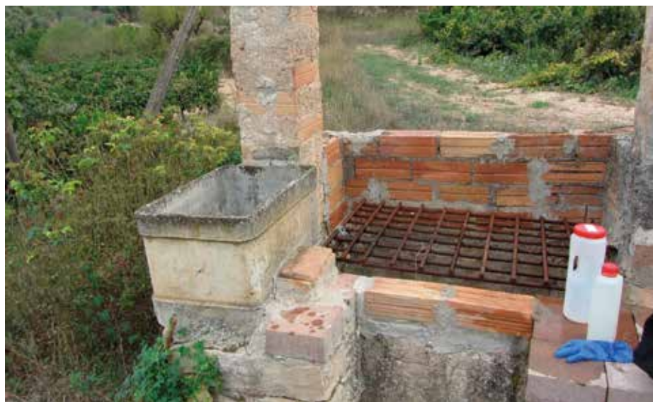
Toma de muestra en la Comarca de Urgel

COCEDER continuará con sus estudios medioambientales y apuesta por una agricultura integrada y sostenible [...]