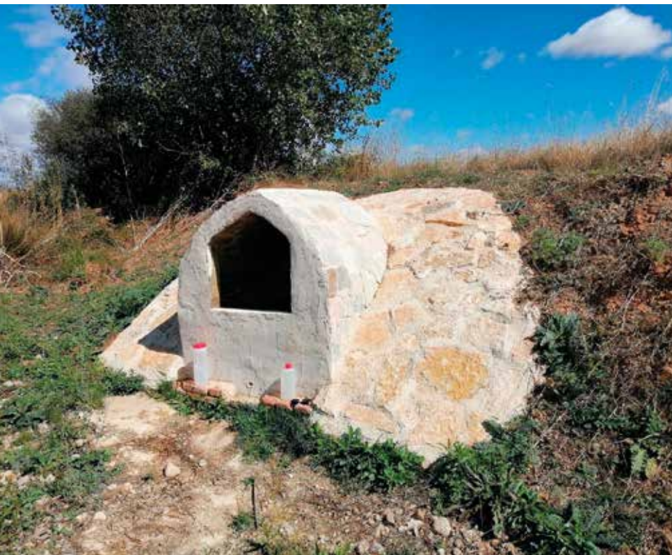
Toma de muestra en la Comarca de Tierra de Campos