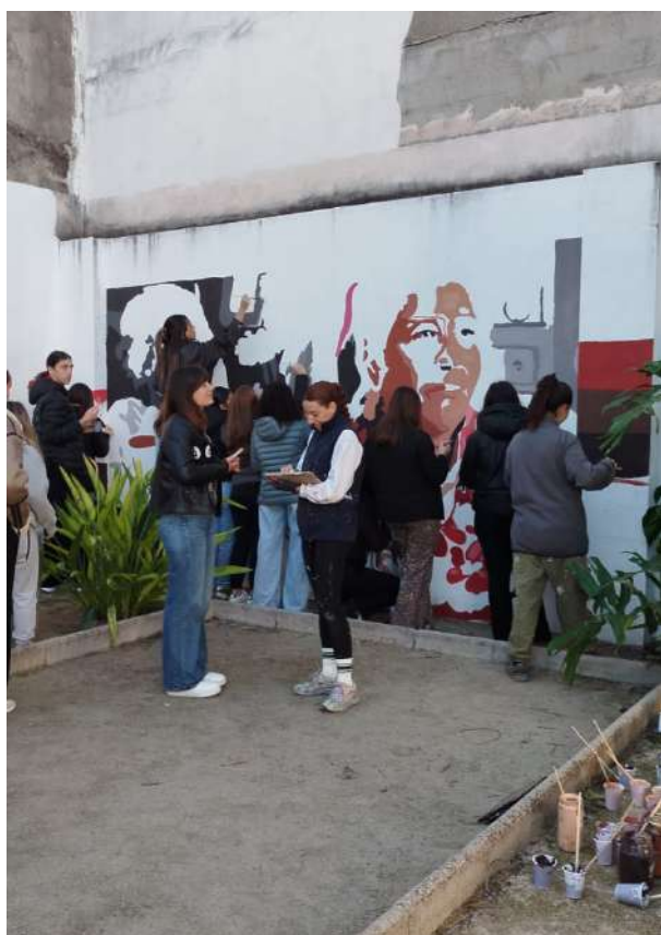
Jóvenes de Beniarjó pintan el mural. Resultado: Foto de portada.