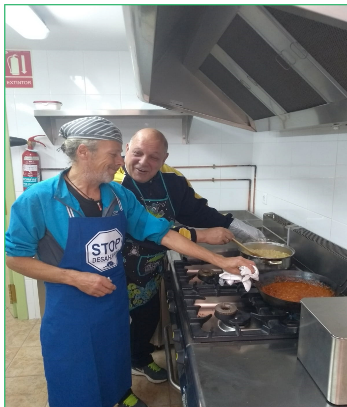
Formación específica en "Certificado de Profesionalidad de Empleo Doméstico" que COCEDER ha llevado a cabo en la comarca de El Barco de Ávila, gracias a la colaboración del CDR Almanzor - COCEDER

Un programa que ha sido subvencionado por la Gerencia de Servicios Sociales de la Junta de Castilla y León.