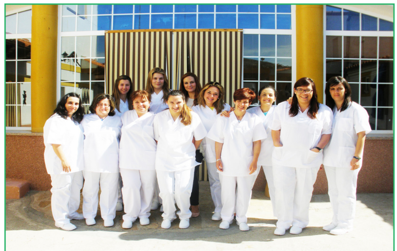
Arriba, varias personas participan en la formación de Ayudante de cocina. Junto a estas líneas, las participantes de uno de los cursos de Atención sociosanitaria en instituciones sociales del CDR Cerujovi - C O C E D E R

menor a mantener relaciones con sus familiares, facilitando así el cumplimiento del régimen de visitas en aquellas familias en las que las relaciones sean conflictivas.