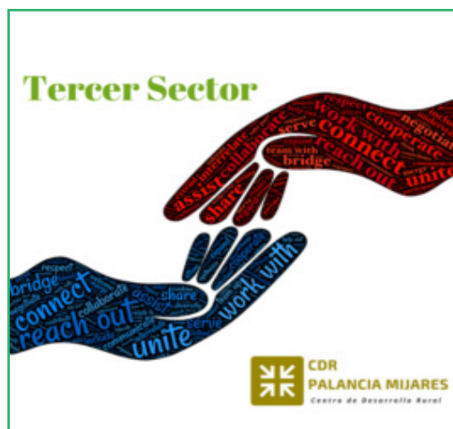
En las imágenes de la derecha, algunas de las actividades que realiza el CDR Palancia Mijares