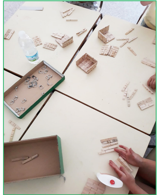
Actividades de la ludoteca de verano del CDR Almanzor - COCEDER

El servicio, dirigido a niños a niñas y niños de Educación Infantil y hasta 4º de Primaria, comenzó el pasado 1 de Julio y se ha prolongado en activo hasta el pasado 30 de agosto, con una y dos aulas respectivamente, según la demanda y la edad de las niñas y niños que han participado, en total treinta.