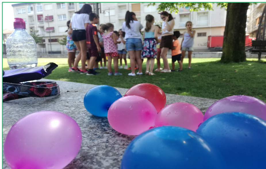
Niñas y niños del programa de conciliación del CDR Portas Abertas - COCEDER

En el CDR son conscientes de que las posibilidades de los progenitores son todas diferentes, por ello, este programa de Conciliación admite a cualquier niño o niña que así lo necesite, y para ello, cuentan con la colaboración de Servicios Sociales.