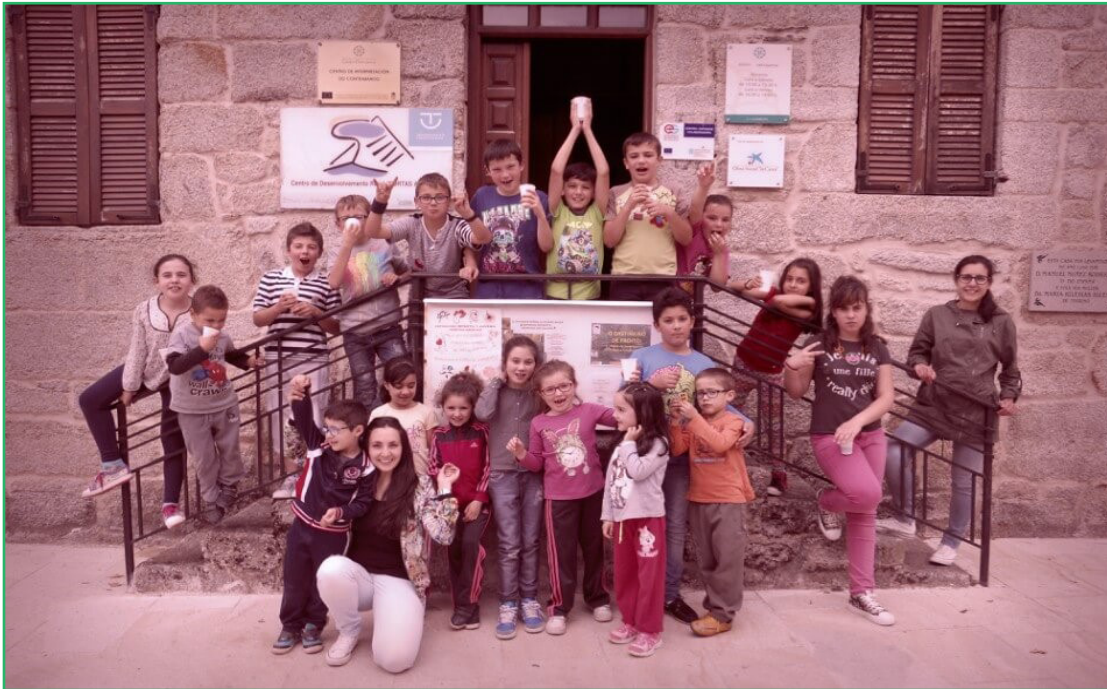
Alumnado del C.E.I.P. Rodolfo Núñez Rodríguez en las actividades del CDR Portas Abiertas - COCEDER (Vilardevós, Ourense)

Algo fundamental que se les escapa a todas las administraciones a la hora de legislar sobre el medio rural es poner los pies en la tierra y buscar a los interlocutores válidos y autorizados, que son los propios habitantes, Ellas y ellos son los verdaderos expertos en su territorio. No se puede legislar sobre un territorio desde la lejanía.