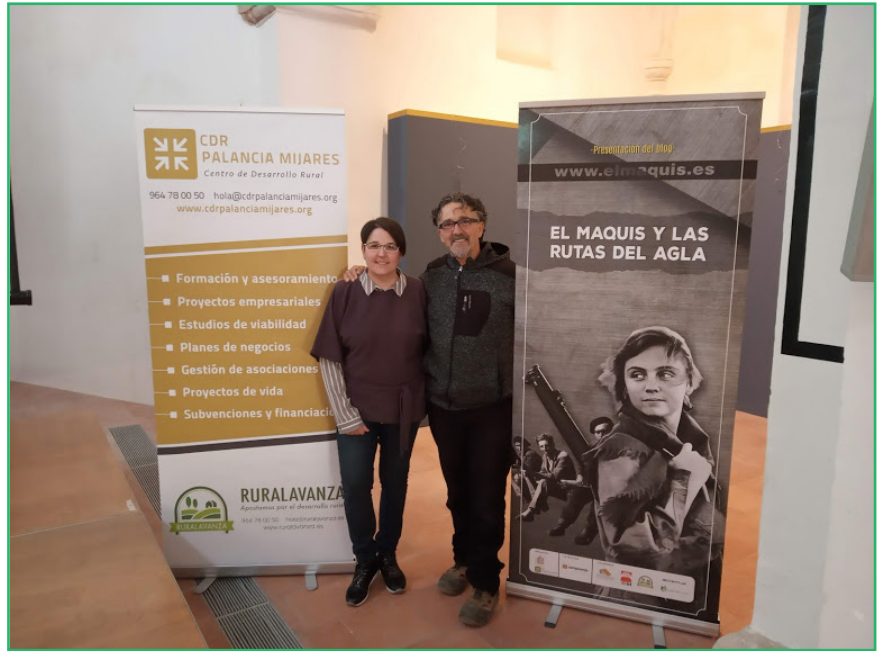
Sobre estas líneas, en la presentación de su proyecto de "Recuperación de memoria histórica"

Además, realizan actividades y programas que están enfocados a trabajar con la población rural de manera integral, abarcando a todos los colectivos existentes y en todos los campos de actuación posibles en función de las necesidades detectadas en cada territorio. Para que las personas puedan desarrollarse satisfactoriamente en todos los ámbitos: personal, social, laboral y económico.