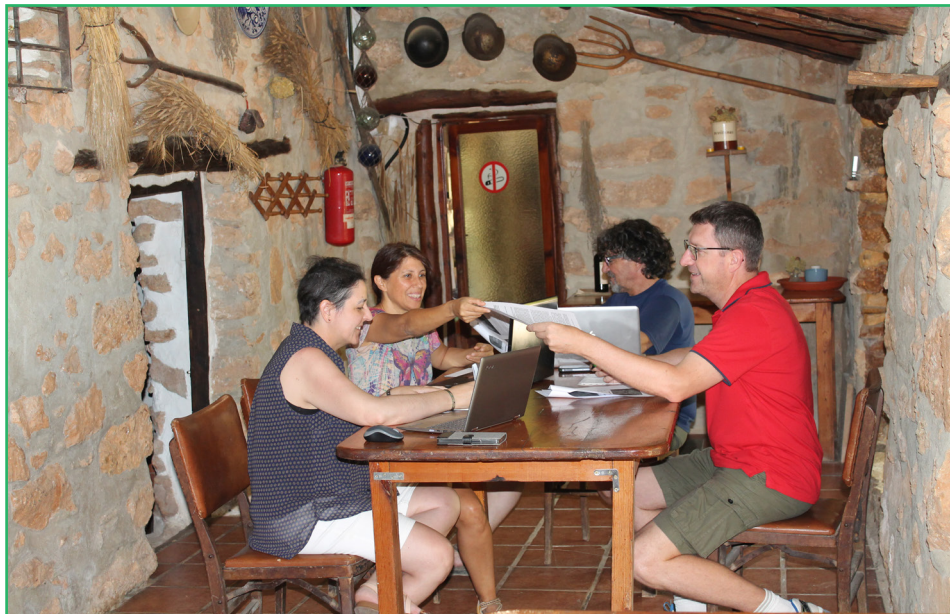
En la imagen, el equipo del CDR Palancia Mijares - COCEDER en una de sus actividades de emprendimiento

Con los proyectos y actuaciones que llevan a cabo pretende superar la barrera de aislamiento geográfico de los pueblos de interior de la provincia de Castellón, contribuir a frenar la despoblación en las zonas rurales, dotando a sus habitantes de las mismas oportunidades que tienen las personas de entornos urbanos y núcleos más poblados. Tiene un compromiso firme con el territorio y su sede se encuentra en la localidad de Castellново (Castellón).