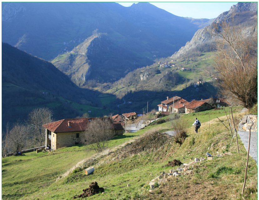
En la parte superior, pueblo de la Sierra de Benalauría (Málaga), mientras que en la imagen inferior, observamos un municipio asturiano, también dentro del ámbito de actuación de los Centros de Desarrollo Rural de COCEDER