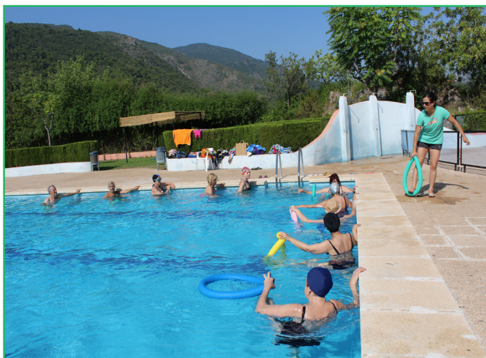
En la imagen, mujeres ejercitándose en una de las actividades del CDR La Safor - COCEDER

El programa de envejecimiento activo se desplaza durante los meses de julio y agosto a las piscinas de los municipios de Beniarjó y Vilallonga, en la comarca valenciana de la Safor.