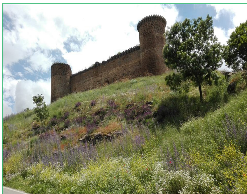
Arriba, vivienda en venta en la zona sur de Tierra de Campos (Tordehumos - Valladolid), y sobre estas líneas, castillo de El Barco de Ávila en la zona de Gredos (Ávila)