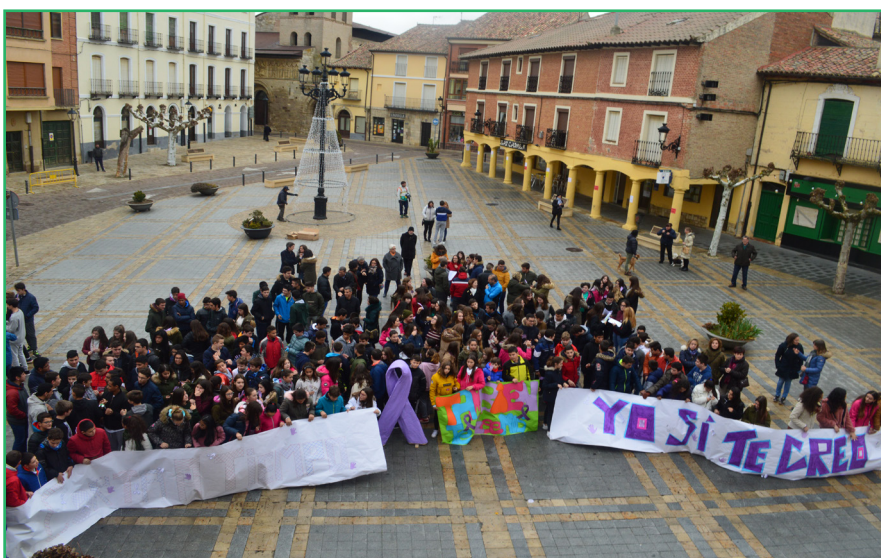
Arriba, varias niñas de la comarca disfrutaron de la Escuela de verano del centro. Sobre estas líneas, concentración en el Día Internacional de la Mujer (8 de marzo) del CDR Carrión de los Condes - COCEDER

Múltiples proyectos han nutrido y acompañado su extensa trayectoria de trabajo a lo largo de casi 29 años de actuaciones en los que han dado respuesta, en la medida de sus posibilidades a: la atención educativa de los niños y niñas de 0 a 3 años, las necesidades de formación de jóvenes y mujeres, el apoyo