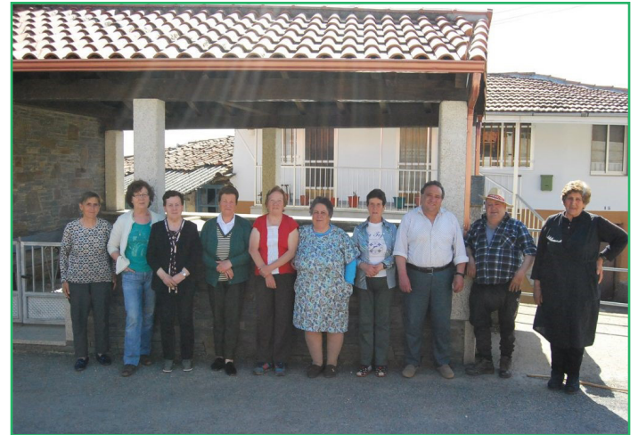
Mujeres y hombres en Vilardevós - Ourense

La razón de que esto ocurra evidentemente no es natural, sino fruto de la burocracia que arrastra a esta pretendida sociedad del bienestar. Esta realidad, también nos hace patente que no sólo es necesario tener un modo de ganarse la vida en el medio rural, sino también, que necesitamos servicios educativos, sociales o sanitarios y comunicaciones de calidad. Los procesos administrativos que en su esencia deben ser garantistas, no lo son tal.