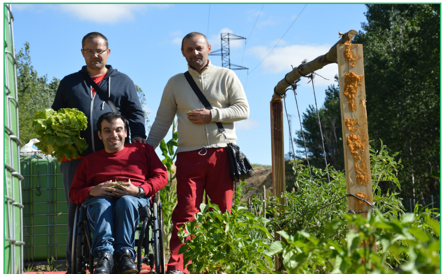
En las imágenes, vemos como personas mayores, jóvenes o personas con diversidad funcional, forman parte también del CDR Carrión de los Condes - COCEDER