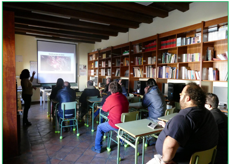
Arriba, Formación en “Operaciones Básicas de Cocina” en la zona sur de Tierra de Campos, gracias al CDR El Sequillo - COCEDER. Sobre estas líneas, formación en “Viticultura, ganadería y agricultura” que COCEDER ha llevado a cabo en la zona norte de Tierra de Campos, gracias a la colaboración del CDR Valdececa - COCEDER

En la que han participado 14 personas, todas ellas, hombres, y lo han hecho en la formación “Operaciones de auxiliar de almacenaje”, tras la que 2 personas han logrado insertarse en el mercado laboral, y para lo que han contado con la colaboración del CDR Carrión y Ucieza.