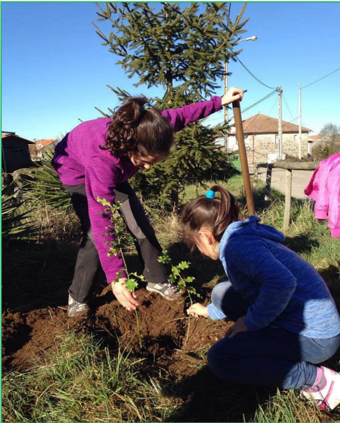
Lodoselo (Sarreaus, Ourense) CDR O Viso - COCEDER