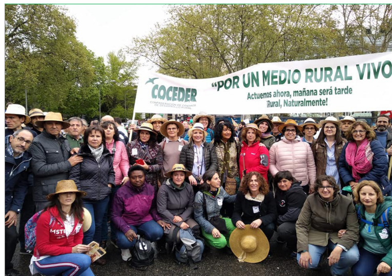
Sobre estas líneas, las personas representantes de COCEDER que acudieron a la manifestación de la "España vaciada" el pasado 31 de marzo, en Madrid

La Confederación de Centros de Desarrollo Rural, COCEDER, se une de nuevo a la lucha contra la despoblación del medio rural de nuestro país, junto a las más de 100 entidades que conforman el colectivo de la España Vacuada, y lo hace sumándose a la decisión de constituir una coordinadora del movimiento.