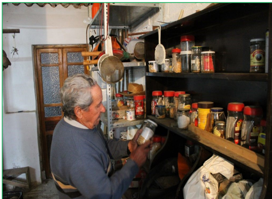
Sierra de Ronda (Málaga) C.D.R. Montaña y Desarrollo - COCEDER

E mpecemos a pensar desde lo pequeño. Si pensamos en grande los pueblos nunca van a estar a la altura de los criterios exigidos. La pobreza rural no es sólo un tema económico. Es el aislamiento, la desconexión, la incomunicación y el fruto de políticas equivocadas centradas en infraestructuras o servicios totalmente inviables e insostenibles, de ahí que las políticas en el medio rural, debido a las variaciones poblacionales, deben ser ante todo versátiles y tratar de aprovechar sinergias, colaboraciones y consensos en cuanto a los ratios a aplicar en servicios educativos, sociales o formativos. No es lo mismo trabajar en una cabecera de comarca que tener que moverse por los pueblos. No podemos establecer el mismo número de alumnos/as por profesor en un colegio de un ayuntamiento rural que en cualquier otro centro educativo. El criterio poblacional no puede ser el único para determinar la ubicación de los servicios: hay que tener en cuenta la dispersión geográfica, vías de comunicación, posibilidad de transporte público,... e incluso plantear servicios móviles.