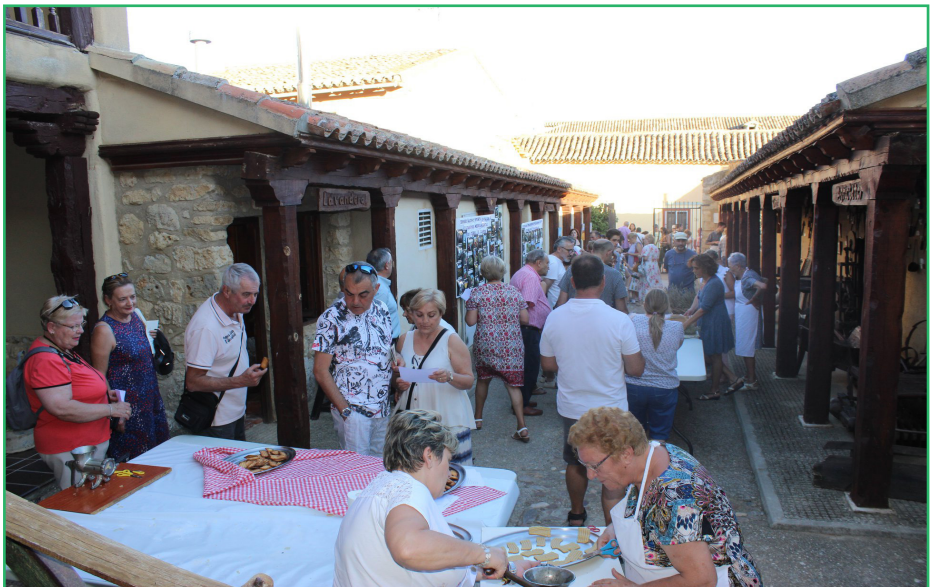
En la parte superior, imagen del taller de plantas aromáticas y sobre estas líneas, taller de repostería tradicional, ambas en las Jornadas de puertas abiertas del CDR El Sequillo - COCEDER

De igual modo, todas las personas que se animaron a visitar el Ecomuseo, tuvieron la oportunidad de participar en los ya conocidos talleres tradicionales que se realizaron estos días y en diferentes horarios y en los que varias mujeres de la zona ejercieron de “expertas artesanas” ilustrando de manera