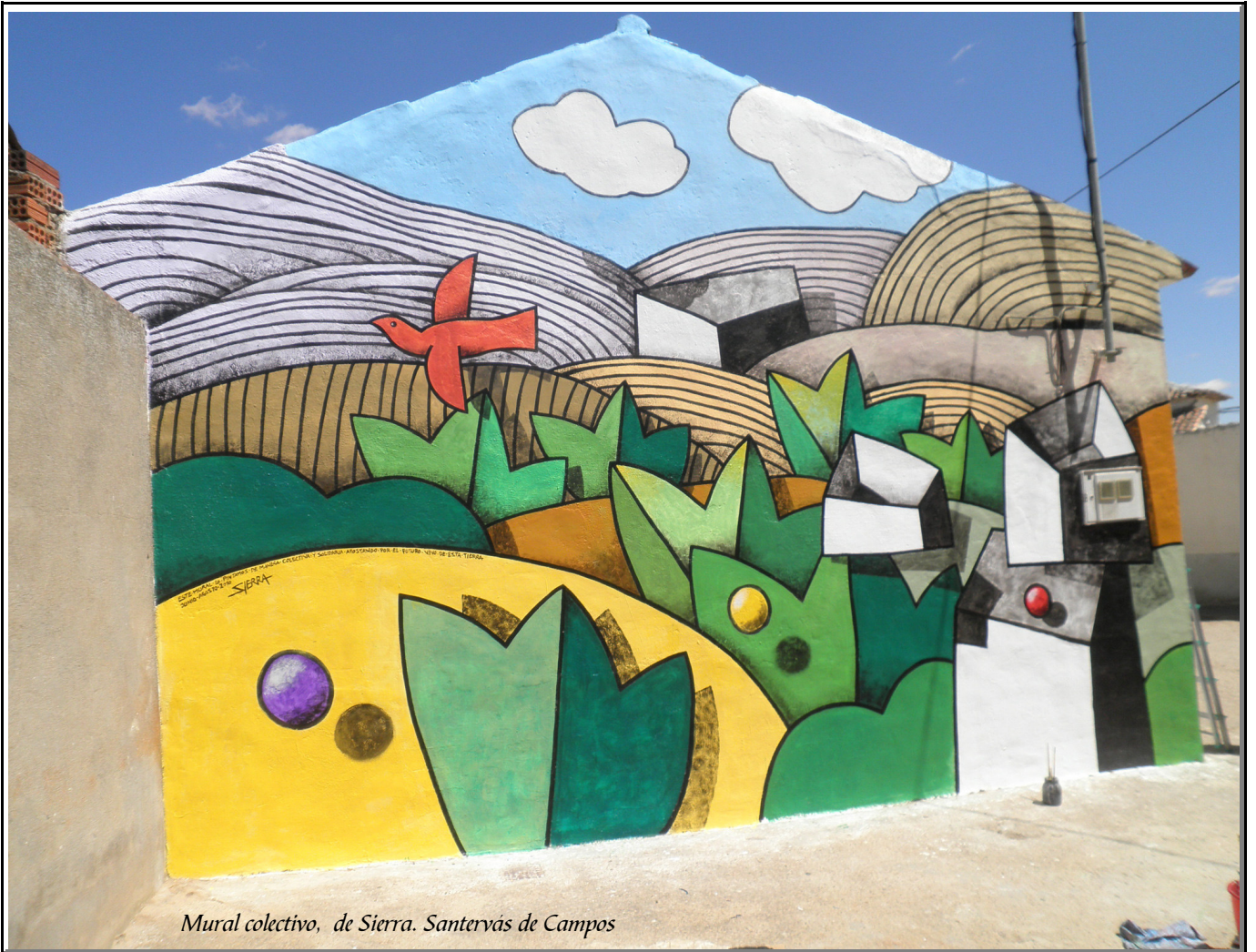
Mural colectivo, de Sierra. Santervás de Campos

Revista para aromatizar la Cultura Popular